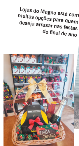
CACAU SHOW - estacionamento gratuito e vagas p/ idoso e necessidades especiais - R. José Manuel de Almeida, 620 - Loja 1 - Jardim Europa