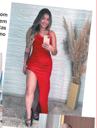
Lojas do Magno está com muitas opções para quem deseja arrasar nas festas de final de ano