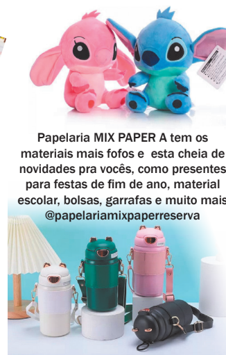
Papelaria MIX PAPER A tem os materiais mais fofos e esta cheia de novidades pra vocês, como presentes para festas de fim de ano, material escolar, bolsas, garrafas e muito mais @papelariamixpaperreserva