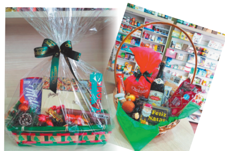
Na Chokolates você encontra cestas personalizadas, panetones nacionais e importados, caneca com chocolate, mimos para amigo chocolate, presentes corporativos e muito mais. Av Presidente Tancredo Neves, 680 loja 03 - Centro