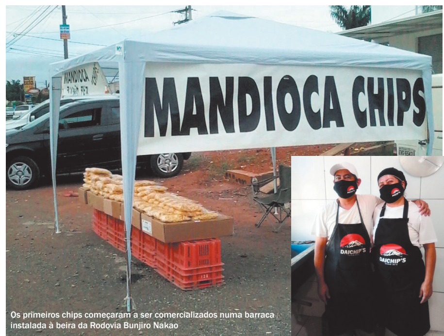
Os primeiros chips começaram a ser comercializados numa barraca instalada à beira da Rodovia Bunjiro Nakao

A partir daí, o casal investiu nas vendas e ampliou os pontos de revenda. “Se tem uma coisa que nos define, digo que é a resiliência. Passamos por várias fases bem