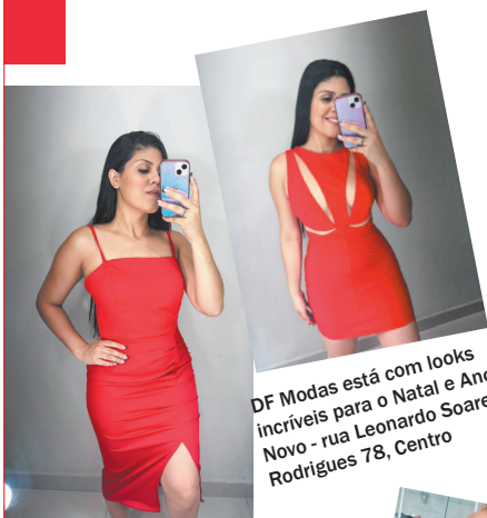
DF Modas está com looks incríveis para o Natal e Ano Novo - rua Leonardo Soares Rodrigues 78, Centro

Prestigie o comércio de Vargem Grande Paulista