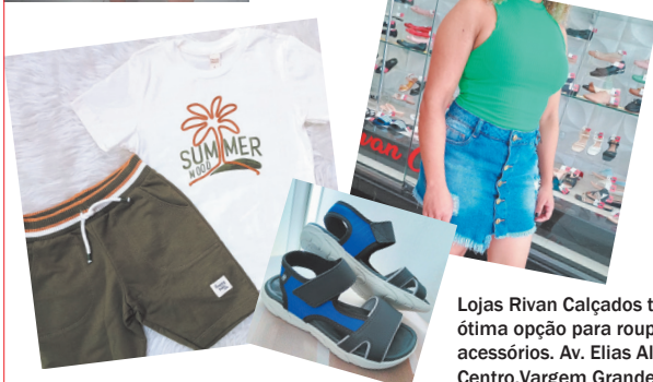
Lojas Rivan Calçados também é uma ótima opção para roupas, calçados e acessórios. Av. Elias Alves da Costa - 497 Centro, Vargem Grande Paulista