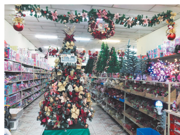
Loja de Presentes BRILHANTE, Av. Elias Alves da Costa, 271 - Centro, tem de tudo para deixar o seu Natal mais bonito e completo