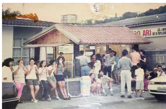
Sorveteria Sorverelli quando foi inaugurada na Rua Valêncio Soares Rodrigues