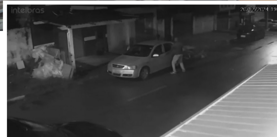
O homicídio ocorreu no bairro Parque do Agreste e imagens de câmeras de segurança ajudaram na identificação da autoria do crime.