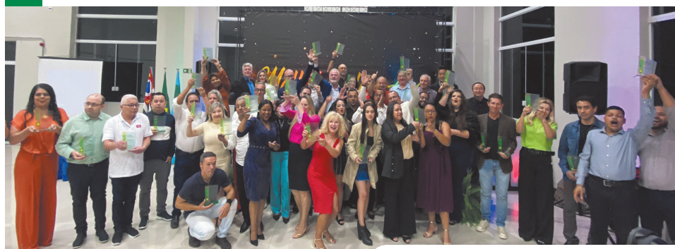
Cerimônia de premiação dos Melhores do Ano 2023

A Associação Comercial e Empresarial (ACE) de Vargem Grande Paulista prepara-se para a 10ª edição do tradicional prêmio Melhores do Ano, que reconhece os comércios e prestadores de serviços que mais se destacaram ao longo do último ano. A cerimônia promete ser mais um marco de celebração e inspiração, reforçando o papel crucial dos empreendedores no fortalecimento da economia local.