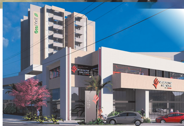
Acima, imagem da BlueFit do Tijuco Preto; à esquerda maquete eletrônica das Academias Gaviões (no EcoMall) e da Sky Fit VGP no Jd. Europa