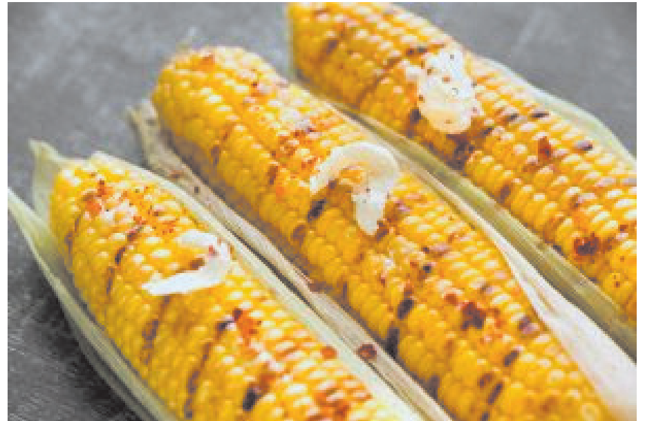
Milho: rico em fibras, vitamina A, vitaminas do complexo B, ferro, potássio, fósforo e cálcio

Outra comidinha que costuma aparecer no cardápio junino é a tapioca. “É uma alternativa sem glúten, rica em carboidratos de fácil digestão. Pode ser recheada com opções saudáveis como queijo branco, frango desfiado ou vegetais. Tudo depende da forma como você prepara”, detalha.