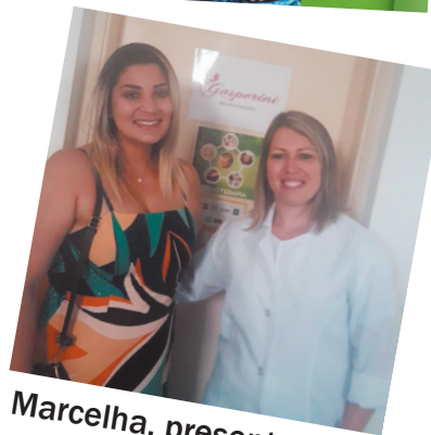
Marcelha, presenteada pela Massoterapia Gasperini