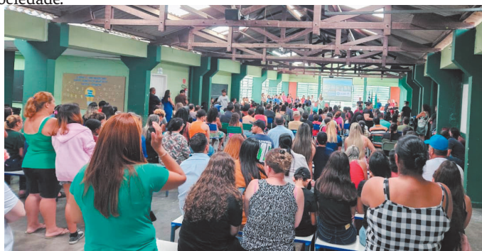
Primeira reunião de pais para anunciar o início do Programa Escola Cívico-Militar

Fortalecimento da disciplina e da segurança escolar - Este objetivo visa criar um ambiente de convivência harmonioso e seguro para toda a comunidade escolar. A presença dos monitores militares auxilia na manutenção da ordem e no cumprimento de normas de conduta, o que ajuda a prevenir casos de violência e bullying. Com uma rotina mais disciplinada, tanto alunos quanto professores conseguem focar nas atividades educacionais com maior tranquilidade, estabelecendo uma cultura de respeito