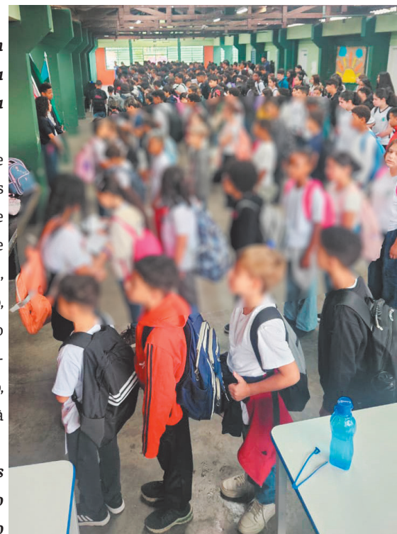
Formatura diária dos alunos que participam do Programa

3. Ambiente e convivência: Projetamos uma escola onde o respeito mútuo seja a regra. Esperamos uma redução drástica nos índices de bullying, violência e preconceito. Ao valorizar o ambiente escolar e os colegas, nossos jovens desenvolvem a inteligência emocional necessária para serem cidadãos exemplares.