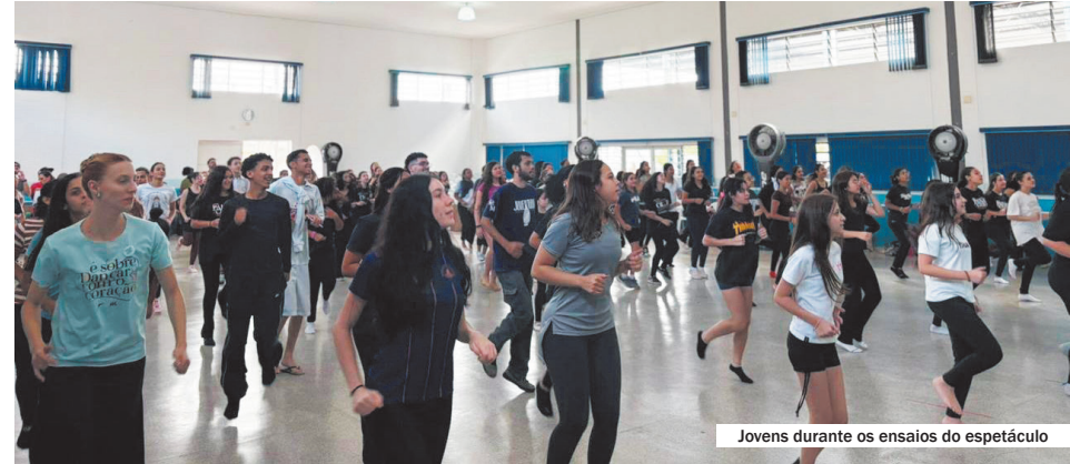
Jovens durante os ensaios do espetáculo