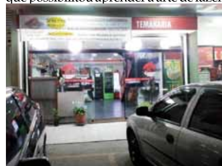
Inaugura do em 2009, o Akai Barah começou num espaço de apenas 60m 2

Sua experiência veio de 12 longos anos em que o empresário trabalhou em um buffet de comida japonesa, o que possibilitou aprender a arte de fazer