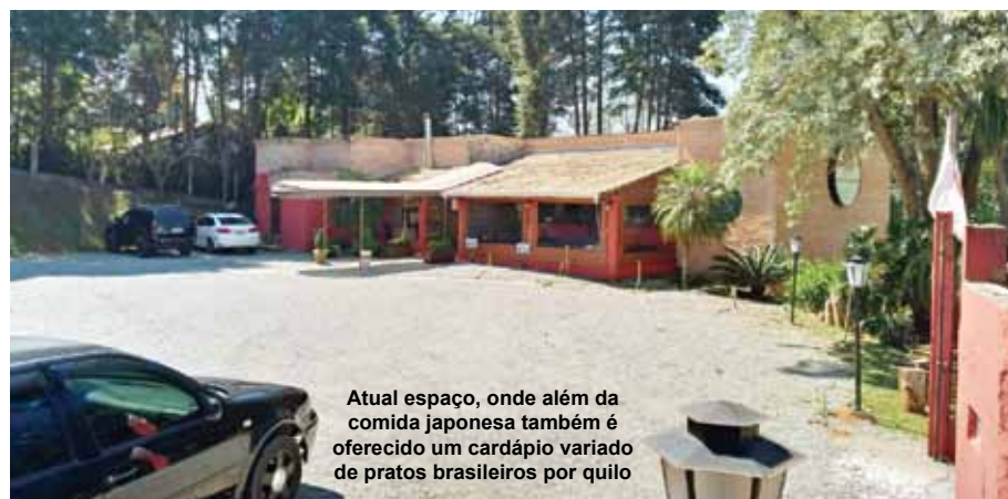
Atual espaço, onde além da comida japonesa também é oferecido um cardápio variado de pratos brasileiros por quilo

sushi, sashimi e várias outras especialidades orientais. "Com o tempo fui assumindo algumas responsabilidades, como organização de eventos, o que incluía toda a preparação envolvendo quantidade de alimentos e bebidas, organização de materiais necessários para eventos e, também, treinamento de funcionários", relembra.