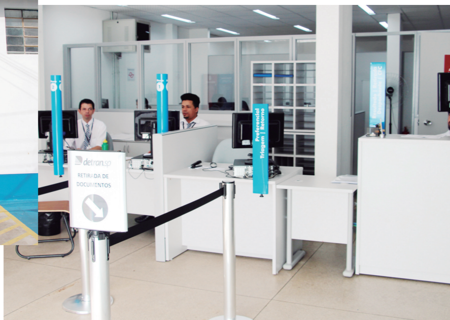
A Seção de Trânsito fica na Rua Valdecir Campestre, 347 (Rua da Delegacia)

O posto fica localizado na Rua Professor Valdecir Campestre, 347, Jardim Olímpio. Funciona de segunda a sexta-feira, das 9h às 17h.