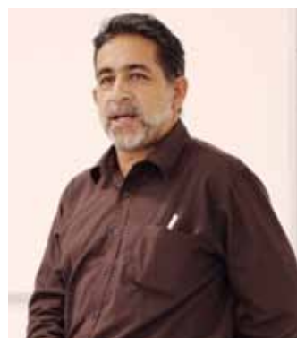
Empresa Sucata Eletroinfo