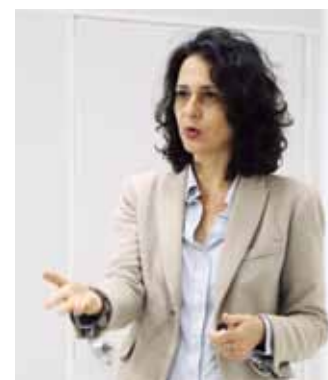
Valência Treinamentos e Consultoria