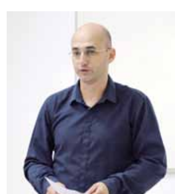
Loppcar Centro Automotivo