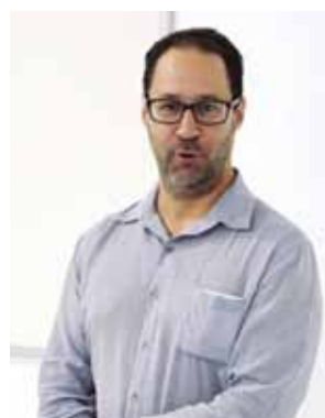
Empresa de Engenharia