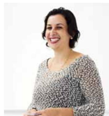
Ateliê da MÔ artesanatos e papelaria