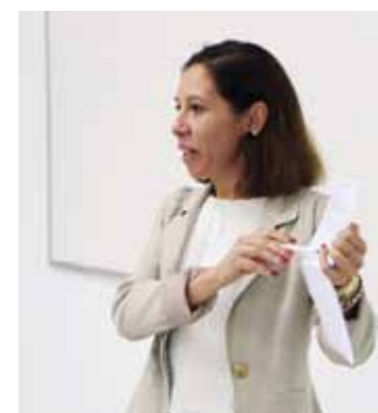
Empresa RHF e Outlet PPKids