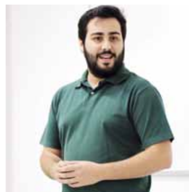
Delta Desenvolvimento de sites e sistemas