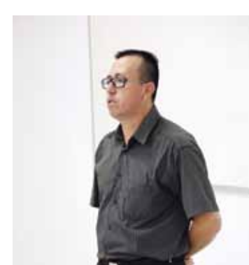
Empresa de Segurança, Monitoramento e Jardinagem