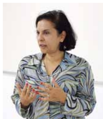
Agência de Propaganda Mediterrânea