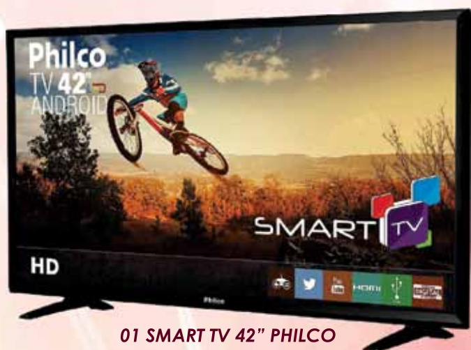
01 SMART TV 42" PHILCO

Compre no comércio local de Vargem Grande Paulista e concorra a vários prêmios