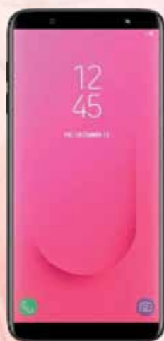
01 CELULAR SANSUNG J8