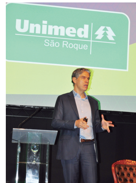
O jornalista e economista Ricardo Amorim

Ainda segundo Amorim, estamos em um momento crescente e favorável para investimentos, pois a tendência é de injeção financeira na economia. “Isso, se a reforma da previdência for aprovada”, ressalta o economista. Um alerta que Amorim fez questão de fazer é que o momento realmente inspira criatividade e vontade de investir, pois é nessa hora que os visionários costumam prosperar. Porém, caso a reforma da previdência não saia, o que ele considera pouco provável, haverá sérios riscos de o atual governo não conseguir avançar politicamente, havendo, inclusive, a possibilidade de não