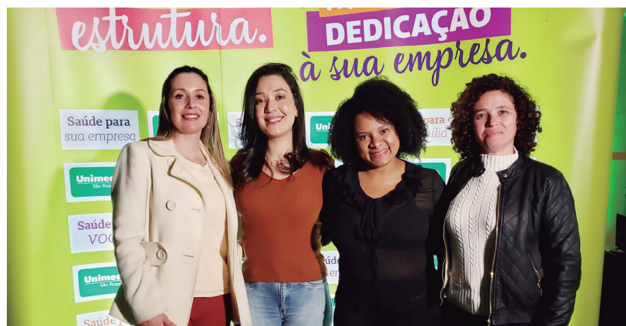
Equipe ACE-VGP também prestigiou o evento empresarial

Ricardo Amorim é um dos debatedores do programa Manhattan Connection da Globo News desde 2003. É também colunista na revista IstoÉ e, até 2018, do jornal Gazeta do Povo.