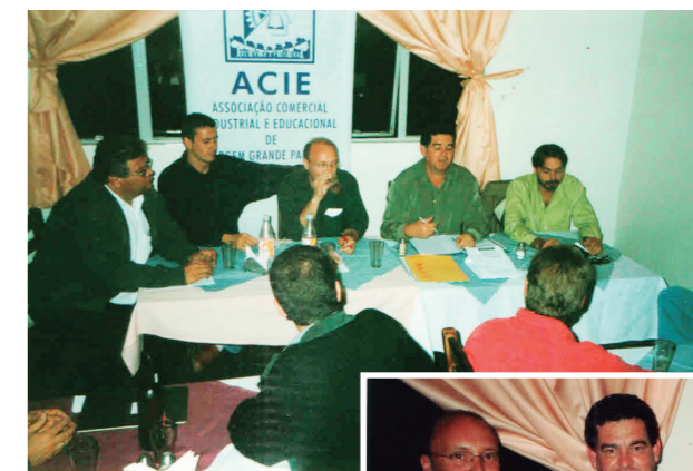
Grupo de comerciantes discutindo a nova denominação de ACE (Associação Comercial, Industrial e Educacional) para ACE (Associação Comercial e Empresarial)