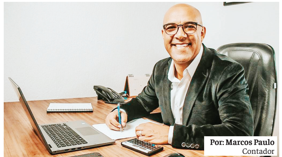
Por: Marcos Paulo Contador

Já a previdência privada do tipo PGBL (Plano Gerador de Benefício Livre) pode ser deduzida com um limite de 12% da renda bruta anual tributável declarada.