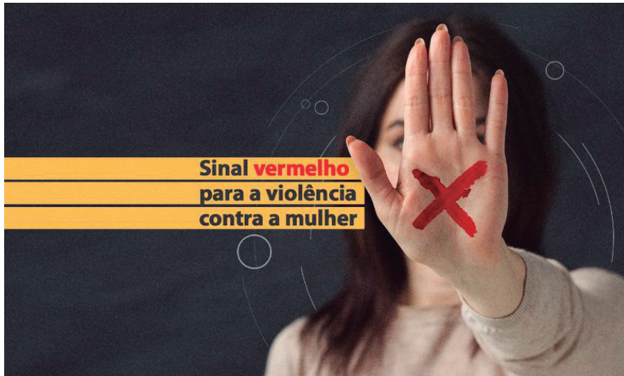
Campanha promovida pelo Conselho Nacional de Justiça (CNJ) e pela Associação dos Magistrados Brasileiros (AMB) pretende incentivar as vítimas de violência doméstica a denunciarem agressões nas farmácias.