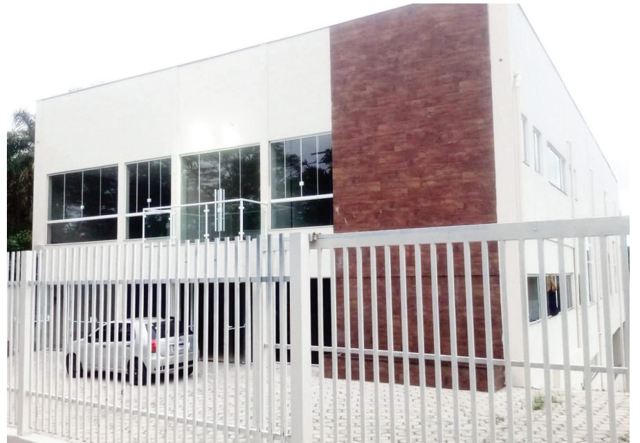
Sede do Centro de Formação - CEFOR, que será inaugurado pela ACE dia 27/01

O prêmio Melhores do Ano 2023 é uma iniciativa da ACE que visa reconhecer o trabalho e a qualidade dos serviços prestados por indústrias, comércios e prestadores de serviços em mais de 50 categorias. A pesquisa de opinião pública, que já está em sua 9ª edição, foi realizada pelo Instituto Sebran Pesquisas, entre os dias 1 a 18/11/23, nas ruas de Vargem Grande Paulista. “Após alguns anos sem realizar a pesquisa por causa da pandemia, a ACE retorna com este evento. Queremos saber quais são as empresas e os profissionais que estão na memória dos consumidores”, afirmou o presidente da ACE.