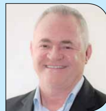
JOSUÉ RAMOS (PR) Pré-candidato a prefeito