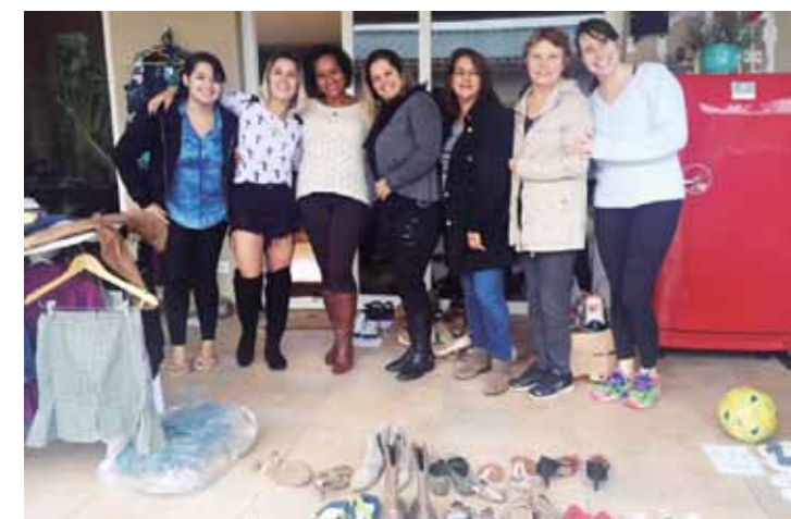
Grupo de participantes que usam o whatsapp para troca e venda de produtos. Desse grupo surgiu a ideia de fazer o bazar do desapego e um leilão on-line.

Para quem está em constante aprendizado não existe crise!