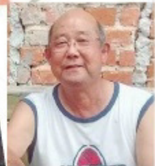
Akira - Rotisserie Doce Tentação