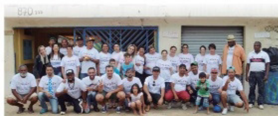
Moradores do Jardim Margarida e colaboradores que organizaram a 5ª Festa Sorriso da Criança