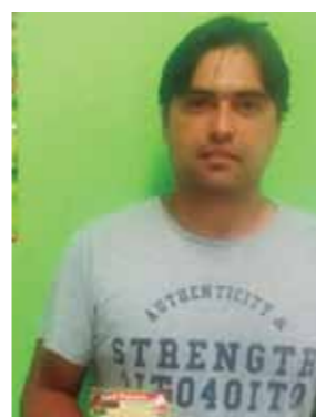
Miltom Soares Mendes Auto Posto Vargem Grande Pta