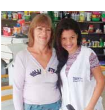
Regina Ap. de Lima Escolhido Alimentos Ltda