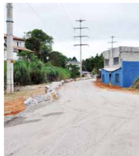
do retorno da Avenida Elias Alves da Costa. O acesso já está sendo utilizado

Apesar de pequeno, o trecho trará grandes benefícios ao comércio central, já que facilitará o acesso a bairros como: São Lucas, São Marcos, Capela, Portão Vermelho I e II, Jd. Miriam, além