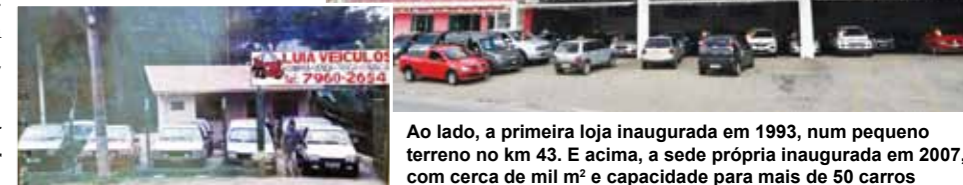
Ao lado, a primeira loja inaugurada em 1993, num pequeno terreno no km 43. E acima, a sede própria inaugurada em 2007, com cerca de mil m 2 e capacidade para mais de 50 carros