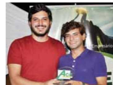
MELHOR POSTO DE COMBUSTÍVEL AUTO POSTO 45