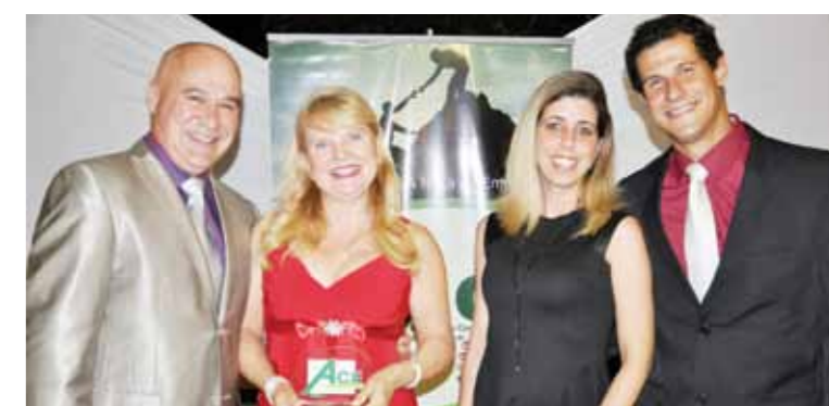
MELHOR ESCOLA DE IDIOMAS: FISK