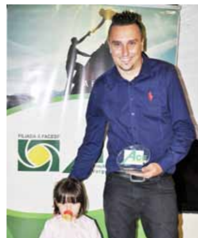
MELHOR LOJA MATERIAIS DE CONSTRUÇÃO: RAPOSO