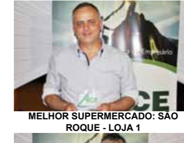
MELHOR SUPERMERCADO: SÃO ROQUE - LOJA 1