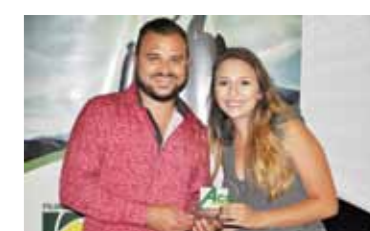
MELHOR IMOBILIÁRIA: XAVIER IMÓVEIS