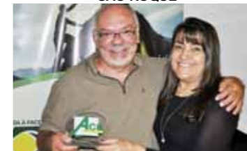
MELHOR BARES/LANCHONETES: L'EXPRESS 43