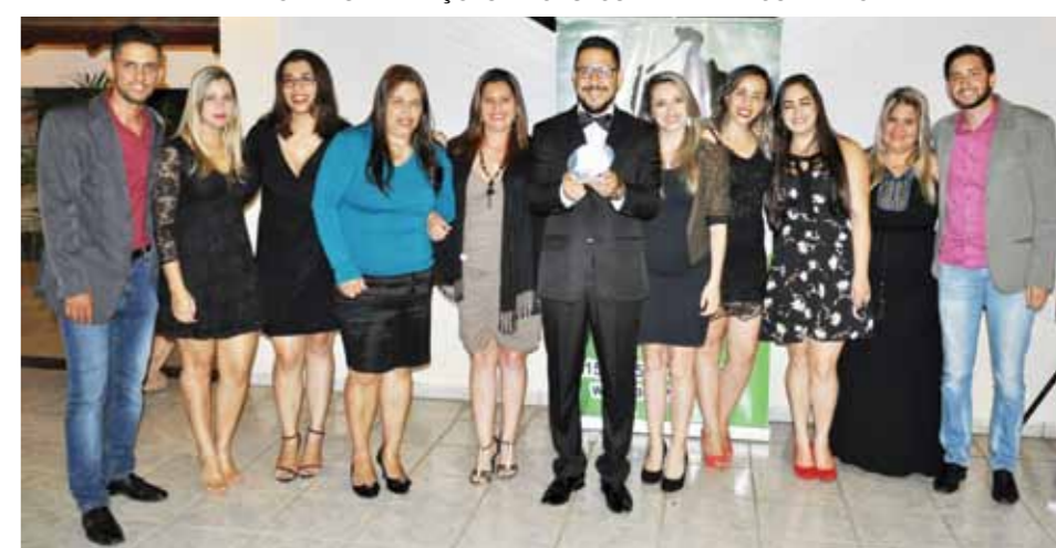
MELHOR ESCRITÓRIO DE CONTABILIDADE: CAMARGO ASSOCIADOS