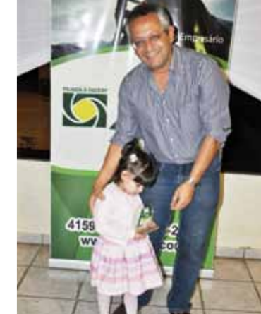
MELHOR LOJA DE MATERIAIS ELÉTRICOS: ELÉTRICA VARGRAN