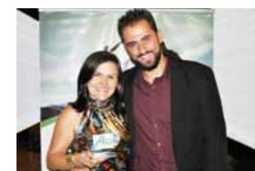
MELHOR HOTEL: FAIOLI