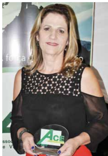
MELHOR FARMÁCIA: PENSE FARMA