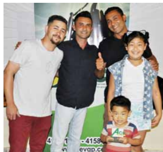
MELHOR SOM E ACESSÓRIOS: KABRAL FILM