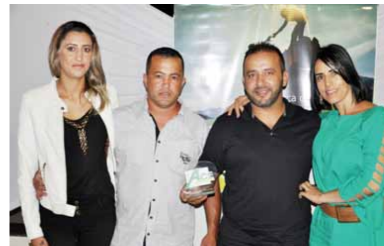
MELHOR DISTRIBUIDORA DE ÁGUA E GÁS: CABECINHA GÁS