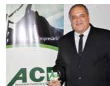
MELHOR CLÍNICA MÉDICA: UNIMED SÃO ROQUE