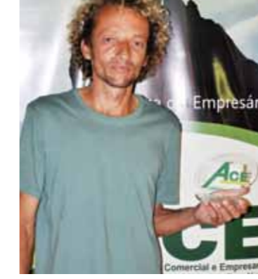
MELHOR LAVA JATO: VGP LAVA RÁPIDO