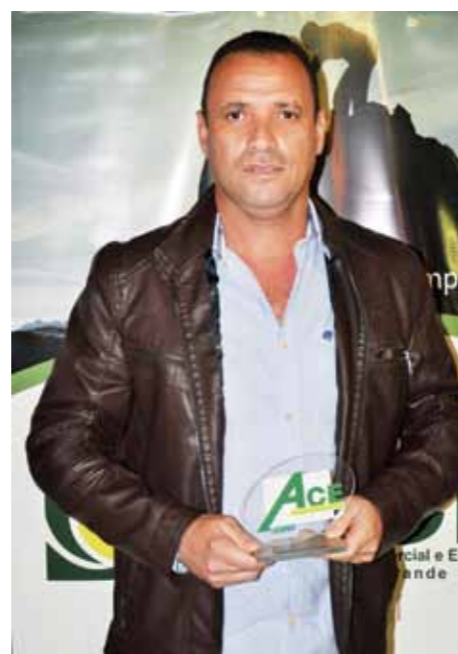
MELHOR SUPERMERCADO: SUPERMERCADO SÃO ROQUE