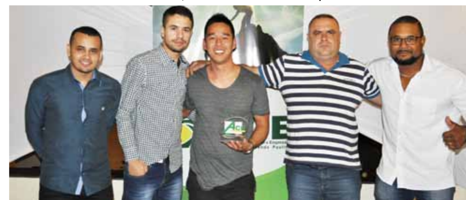
MELHOR CASA DE RAÇÕES PRODUTOS VETERINÁRIOS: TREVO