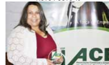
MELHOR OFICINA DE SERVIÇO AUTOMOTIVO: REGINALDO PNEUS