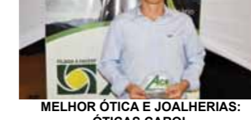
MELHOR ÓTICA E JOALHERIAS: ÓTICAS CAROL