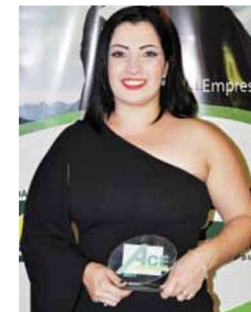
MELHOR CALÇADOS MAS/FEM E INFANTIS: RIVAN CALÇADOS