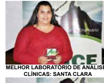
MELHOR LABORATÓRIO DE ANÁLISES CLÍNICAS: SANTA CLARA