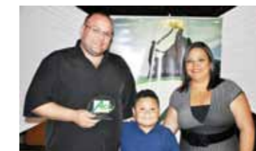
MELHOR LOJA DE INFORMÁTICA: JR INFORMÁTICA