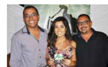
MELHOR MADEIREIRA: MADEIREIRA GIOMAR