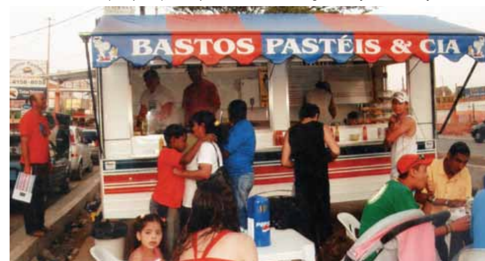
Trailer do Bastos quando a Rodovia ainda não era duplicada e ao lado quando ainda era barraca

do conforme a necessidade dos clientes. Digo sempre: tudo o que você fizer com afinco, respeito e perseverança você vence! E eu sou o retrato fiel de Vargem Grande, vim para cá com a esposa e filhos, e o pouco que tenho consegui aqui nesta cidade, amo este lugar, fico triste quando maltratam esta cidade com palavras ou ações. Esta cidade me acolheu, me respeitou e abriu portas”.