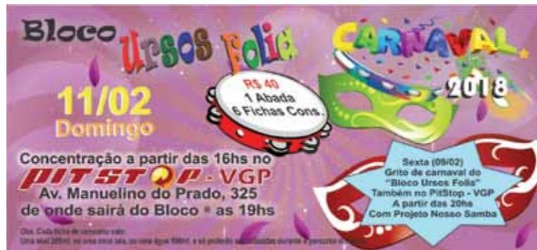
O Bloco dos Ursos já está se organizando para entrar na Avenida no dia 11 de fevereiro. A concentração será a partir das 16 horas, no Pit Stop.

Para quem vai curtir o feriado de Carnaval em Vargem Grande Paulista, não vai faltar diversão. A Prefeitura, por meio do Departamento de Cultura, promoverá o VGP Folia Fest 2018. A maior festa da cultura popular será realizada na Rua Serra da Mantiqueira (Rua da feira), com quatro noites de folia nos dias 10, 11, 12 e 13 de fevereiro, a partir das 20h, e dois matinês nos dias 11 e 13 (sábado e terça-feira), das 14h às 18h.