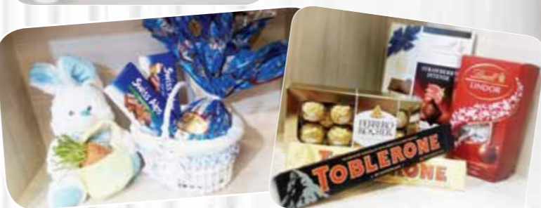
Chokolates: ovos de páscoa, produtos nacionais e importados, cestas, kits e uma grande variedade de produtos