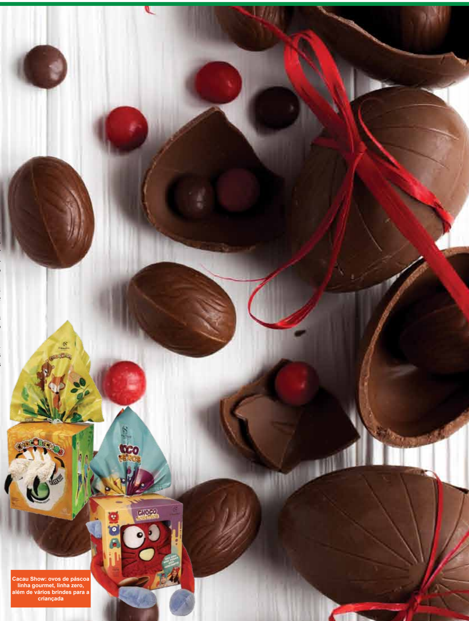
Cacau Show: ovos de páscoa linha gourmet, linha zero, além de vários brindes para a criançada