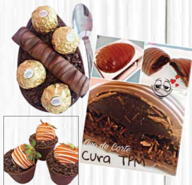
Santa Gula Gourmet: ovos gourmet, de corte, cup cake e muitas outras gostosuras